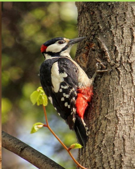
БОЛЬШОЙ ПЕСТРЫЙ ДЯТЕЛ