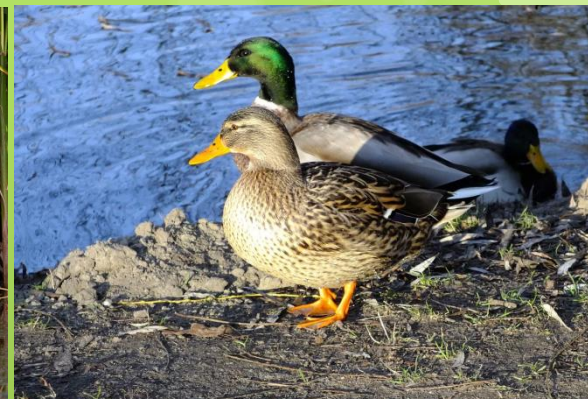
ДИКАЯ УТКА КРЯКВА